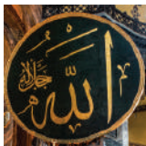
ALLAH oo ku qoran Carabi

Masjidka (Masjid): Meel nadiif ah oo loogu talagalay salaadda, halkaas oo ay Muslimiintu inta badan u isticmaalaan salaadda iyo cibaadada.