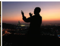
Muslim baryaya ALLAH (Ilaaha runta ah)