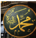
Muxammad oo ku qoran Carabi