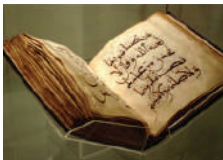
Qur'aanka Sharafta Leh